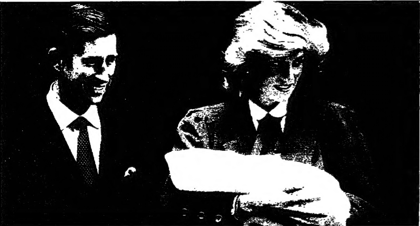
● في ١٦ ايلول وضعت اللبدي ديانا زوجة ولي العهد البريطاني طفلا ثانيا سمي هنري